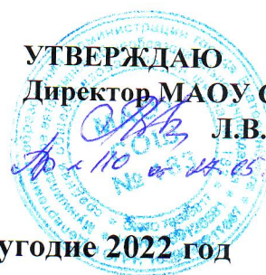
График прохождения КПК, II полугодие 2022 год